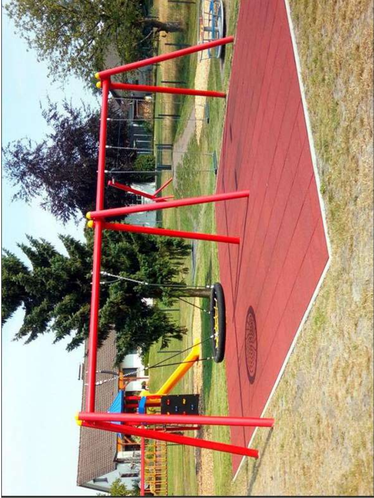
Beispiel für neue Schaukel mit Fallschutzmatten